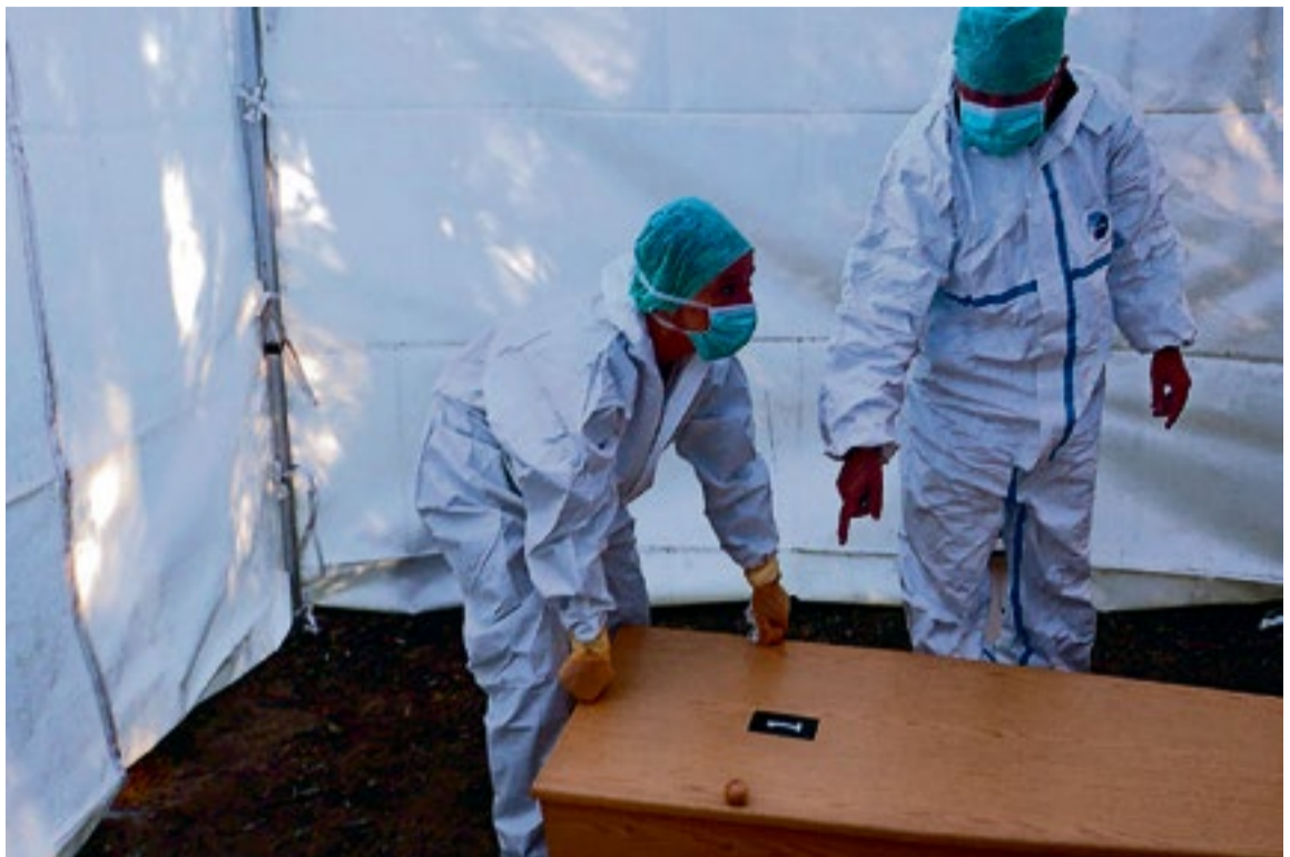
De heropening van het graf van een anonieme dode voor onderzoek verloopt uiterst zorgvuldig.